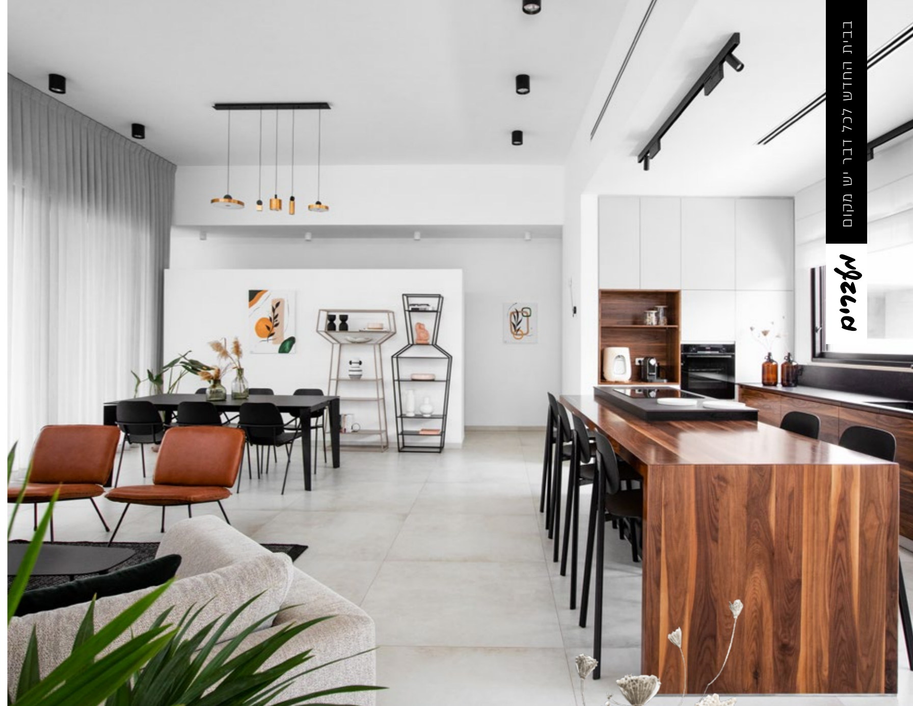
קבלן מבצע: רפאל הנדסה בניה עד מפתח | וילונות: ענק הילונות

אורכו של הפרויקט, הדגישה הדיירת את נושא האחסון כדי שאפשר יהיה בכל עת לשמור על מראה נקי ותחושת מרחב באין מפריע. בקשתה מולאה במלואה על ידי שירן שכבר בשלב התכנון יצרה גומחות מותאמות לארונות בכל החדרים, מבואת הכניסה, המסדרונות, חדרי הרחצה, בתכנון המטבח ובעיצוב פרטי הריהוט בסלון.